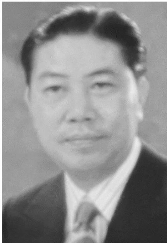
Thủ tướng Nguyễn Bá Cẩn