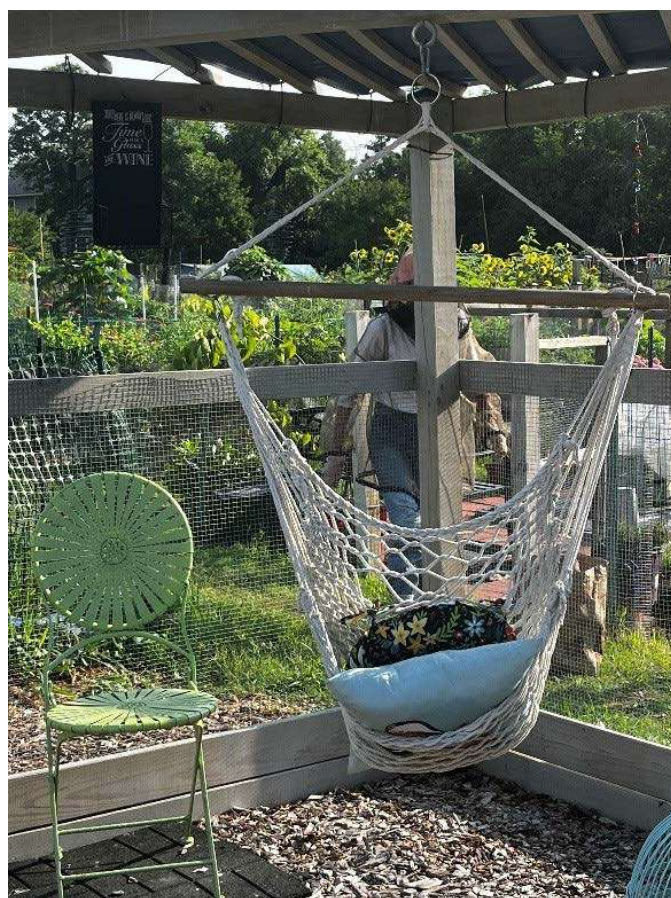
Gió thổi vi vu / Vồng dưa kéo kẹt / Quên cả nhọc mệt / Hòa với thiên nhiên.

tôi háo hức pha trà uống rồi rảo bước ra vườn từ tinh mơ, không đi là... nhớ! Tình yêu thiên nhiên, sự đam mê trồng trọt đã “nhập” vào tôi lúc nào không biết. Mỗi ngày thấy một trái non lú ra, thấy một củ quả đã “tới” cho mình thò tay hái, thấy cành lá sum suê um tùm, thấy hoa tím hoa vàng, trái xanh trái đỏ, thấy bầy ong rộn ràng bay lượn hút nhụy gieo phấn, xúc đất lên thấy những con trùng ngày đêm âm thầm xới đất và nhai nát những vỏ chuối vỏ rau mình chôn xuống để biến chúng thành phân