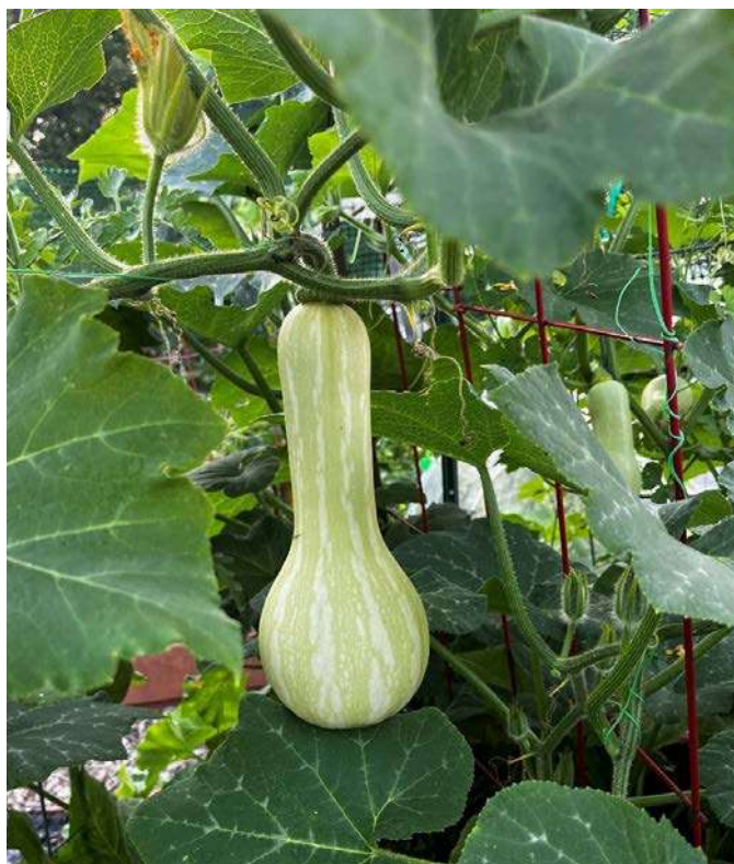
Butternut squash trong vườn nhà

Cuối cùng thì cũng có được vài cây đậu bắp, một giàn đậu đũa, hai cây cà chua, toàn của không vốn. Bầu, bí, mướp, mồng tơi được các chị bạn cho hạt đều mất tích không xuất hiện. Ớt xanh, ớt đỏ, ớt hiểm, cà tím thấy đều bật vô âm tín. Bù lại có vô số những “khách không mời mà đến”. Ruồi nhặng, muỗi mòng, trăm giống sâu bọ