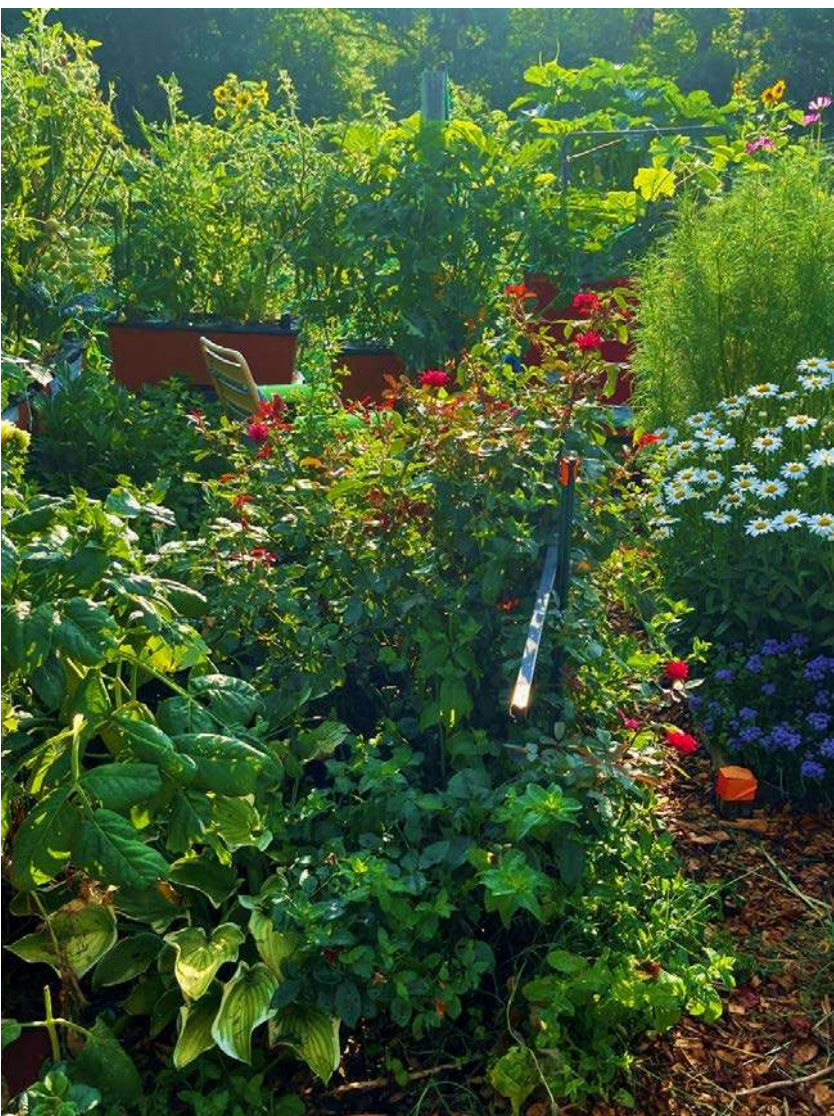
Mặc ai trồng củ trồng rau. Ta trồng hoa đẹp đủ màu làm vui

Điều lạ lùng nữa là năm nay mỗi sáng thức dậy